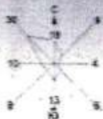
Схема источников шумового воздействия