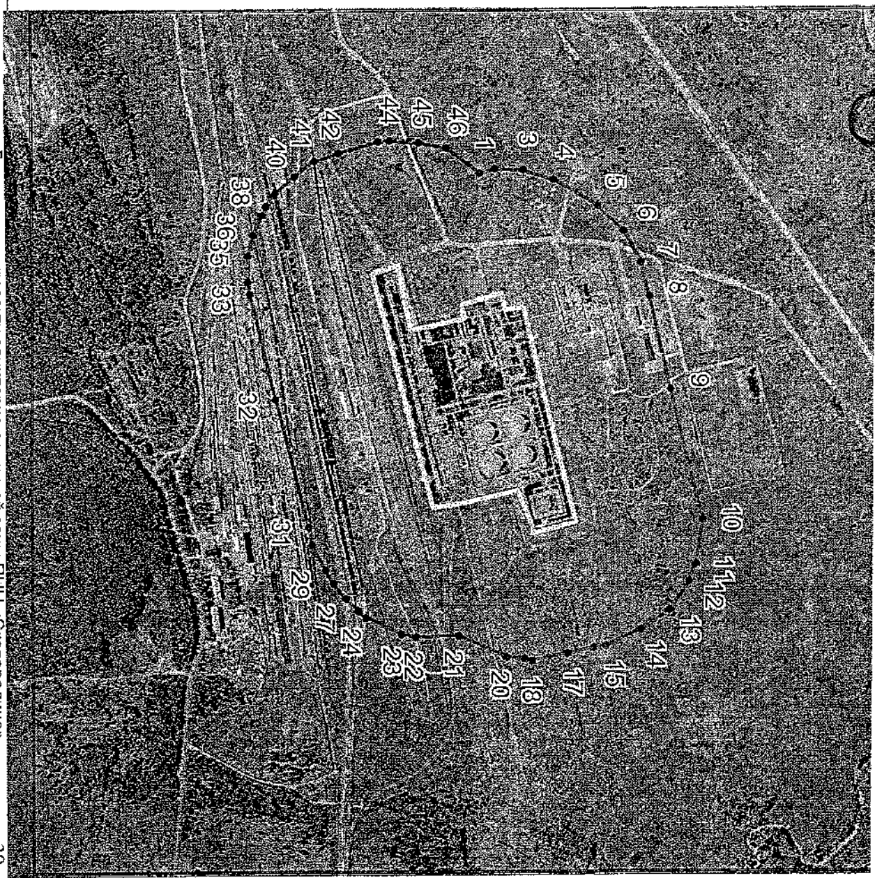
Дополнение к проекту санитарно-защитной зоны ПНН «Сковородино»